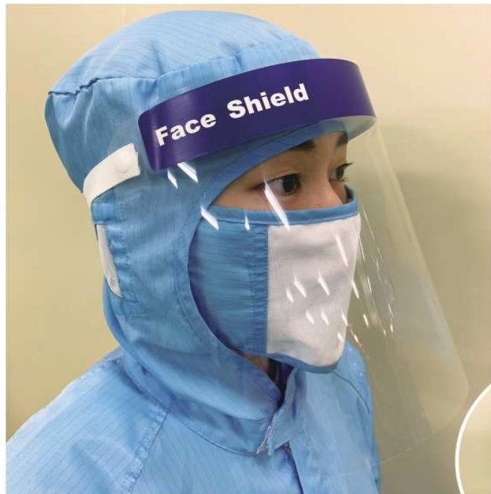
曇り止め・帯電防止処理仕様 製品サイズ:325mm×220mm